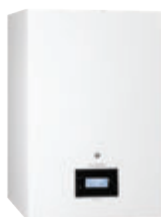
Vivadens Smart BIC